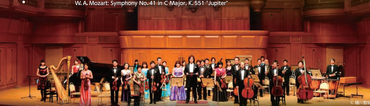
Izumi Sinfonietta Osaka