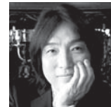
飯森範親 指揮 Norichika Iimori