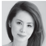
田部京子 ピアノ Kyoko Tabe

http://kazukitomitaorg213.wixsite.com/home